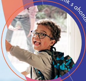
Bolesnik s ahondroplazijom