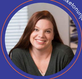
Bolesnica s fenilketonurijom