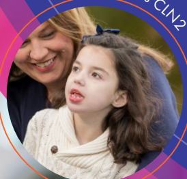
Bolesnica s CIN2