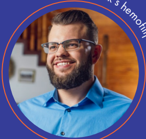
Bolesnik s hemofilijom