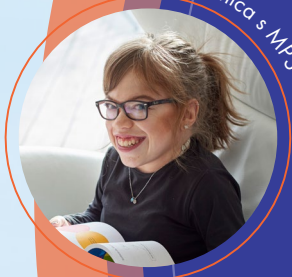
Bolesnica s MPS VI